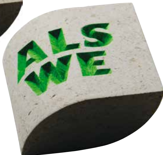
Michiel Deylius, Mogelijkheden . 2022, 100 × 100 × 50 mm, bianco del mare