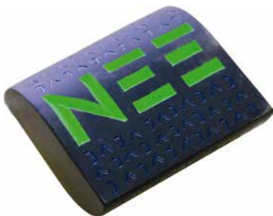
Michiel Deylius, Twijfel . 2022, 100 × 100 × 50 mm, liguriaans leisteen